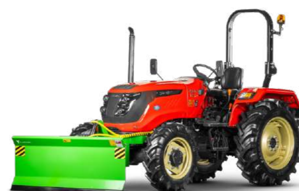
Отвал Flagman | Флагман 5090 SG к трактору Solis 50 с гидроповоротом