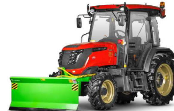
Отвал Flagman | Флагман 5090 SG к трактору Solis 50 с гидроповоротом