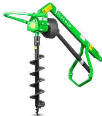
Земляной бур Flagman | Флагман МЗА1 | МЗА3 | М2