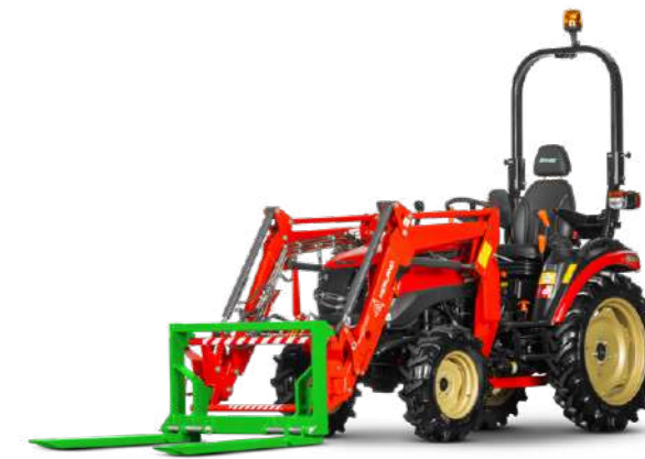
Вилы палетные Flagman | Флагман 80 (20-30) | 160 (45-50)