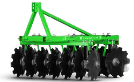
Борона дисковая Flagman | Флагман К 1300 | К 1500 | К 1800 | К 2000