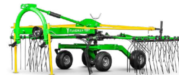
Грабли-сеноворошилки роторные Flagman | Флагман RR-06-09