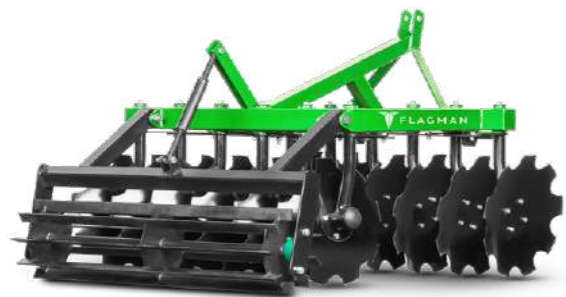
Каток планчатый для бороны Flagman | Флагман К 1300 | К 1500 | К 1800 | К 2000