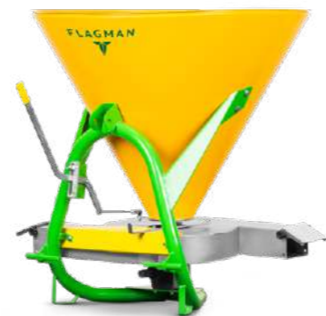
Разбрасыватель навесной Flagman | Флагман R350S (садовый)