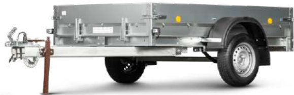
Прицеп Flagman | Флагман С/ПТТ – 0,5-0,7 с ПСМ к мини-трактору (универсальный)