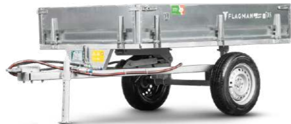
Прицеп Flagman | Флагман С/ПТТ – 1,5 с ПСМ к мини-трактору (самосвальный)