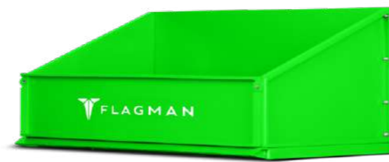
Кузов задненавесной Flagman | Флагман БА (310 л)