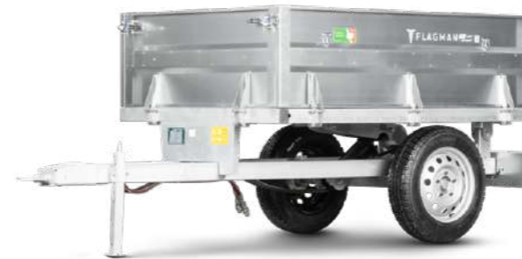
Прицеп Flagman | Флагман С/ПТТ – 2,0 с ПСМ к трактору (самосвальный)