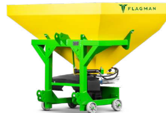
Разбрасыватель навесной Flagman | Флагман R600