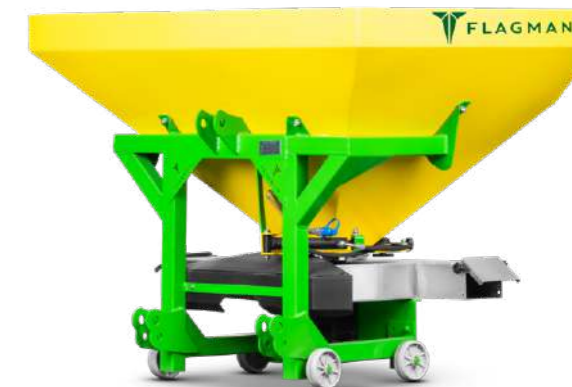
Разбрасыватель навесной Flagman | Флагман RR600S (садовый)