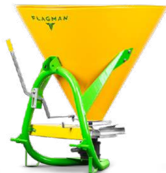
Разбрасыватель навесной Flagman | Флагман R350