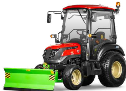
Отвал Flagman | Флагман 1826 SG к трактору Solis 16 | 22 | 26