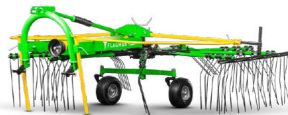
Грабли-сеноворошилки роторные Flagman | Флагман RR-05-09