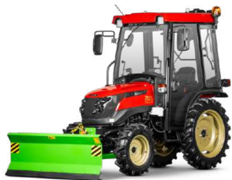
Отвал Flagman | Флагман 1826 SG к трактору Solis 16 | 22 | 26