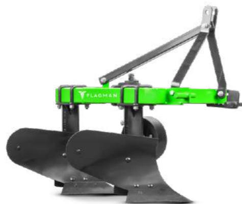
Плуг Flagman | Флагман ЕКО 2,20 | 3,20